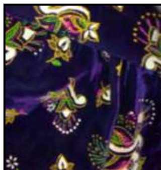
۱۲- پارچه با نقوش انتزاعی از جنس مخمل برای تهیه پیراهن و شلوار- (منبع: نگارنده)