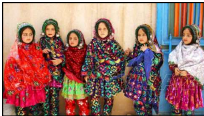
۱۷- پوشش دختران در مراسم عروسی