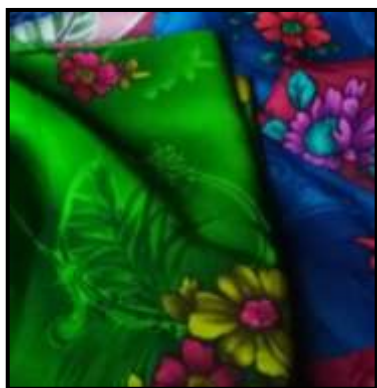
۱۱- پارچه‌هایی با نقوش گیاهی از جنس اندولزی برای تهیه پیراهن و چارقد