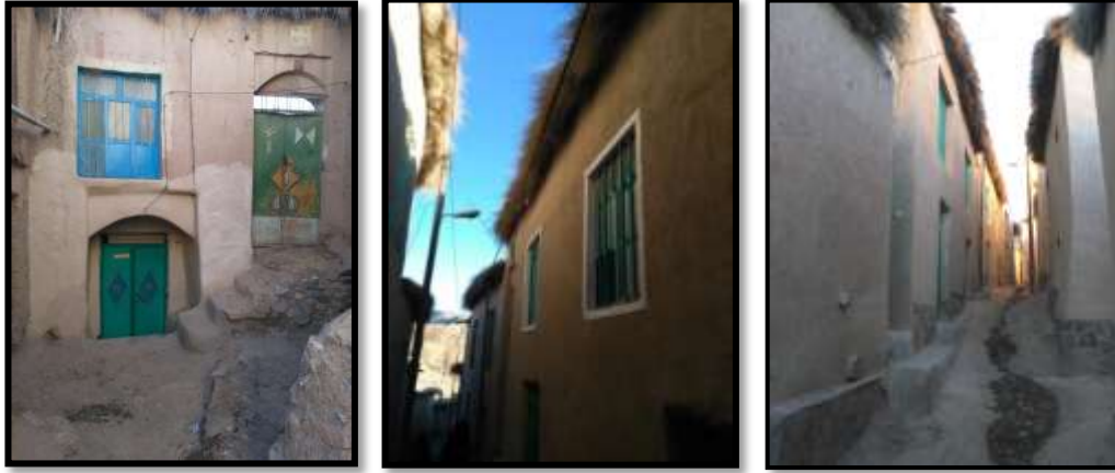
۵- کوچه ها و معماری روستای چنشت - نگارنده