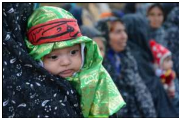
۱۹- زنان و کودکان در مراسم عزاداری محرم