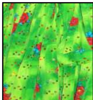
۱۳- پارچه با نقوش گیاهی و هندسی از جنس اندولزی برای تهیه پیراهن و چارقد