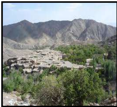
۲- نمای کلی از روستا

روستای چنشت از توابع شهرستان سریشه است که در ۶۰ کیلومتری جنوب شرقی بیرجند و در ۷ کیلومتری مزار بی بی زینب خاتون (مزار کاهی) قرار دارد. (تصویر ۱) چنشت را هم وزن بهشت می دانند که پیش ازین به علت زیبایی و وجود رودخانه فصلی و سرسبزی آن، گروهی از دامداران این منطقه را جهت سکونت خود برگزیدند و به مرور زمان نام کنونی را به خود گرفته است. گروهی نام روستا را بر گرفته از همین رودخانه ها می دانند که "چند شط" نام گرفته و بعدها به نام چنشت تغییر یافته است. (مصاحبه با دهیار روستا، ۱۳۹۴) این روستا اقلیمی معتدل و کوهستانی دارد و دارای بافت مسکونی و چشم انداز کوهستانی زیبا و جذابی است که در میان باغات گردو و دیگر میوه ها قرار گرفته است. (تصویر ۲) چنشت قدمتی کهن دارد و در دوره های مختلف مورد بازسازی قرار گرفته است.