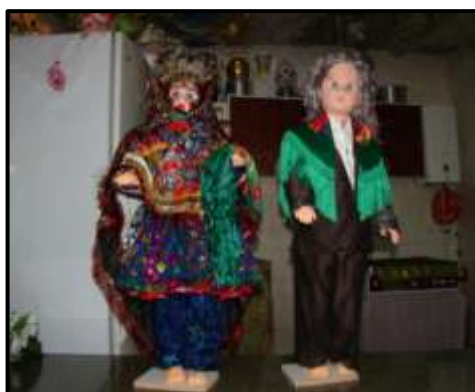
۱۸- عروسک‌های عروس و داماد چنشتی