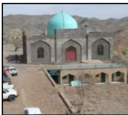
۸- بنای جدید امام زاده از نمایی دیگر