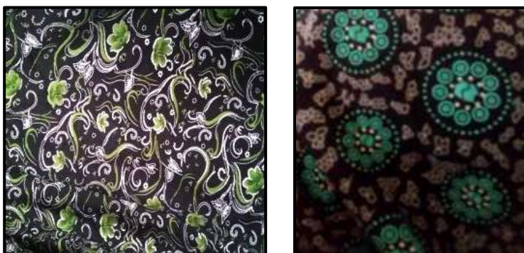
۱۶- پارچه چادری با نقوش گیاهی و هندسی

چادر: به رنگ های مختلف، گلدار و شبیه چادر معمولی است؛ با این تفاوت که در مراسم از چادری استفاده می کنند که کوچکتر و کوتاهتر است؛ به کلاه پول وصل است و از پشت سرشان آویزان است. رنگ و جنس پارچه با توجه به سن شان متفاوت است. دختران جوان بخصوص تازه عروس ها، رنگ های شاد و روشن و حتی سفید گلدار و زنان مسن رنگ های تیره می پوشند. ولی در مواقع عادی و عبور و مرور در روستا اکثراً از چادرهای رنگی و تیره با نقوشی به رنگ سبز و آبی استفاده می کنند. (تصویر ۱۶)