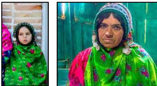
۱۵- چارقد متصل به کلوته که به دور سر پیچیده شده - (منبع: mehrnews.com)

چارقد: نوعی روسری بزرگ است که اهالی به آن چهارقد نیز می گویند ولی در زبان عامیانه چارقد گفته می شود، با این تفاوت که مستطیلی با عرض ۱/۵ و طول ۲ متر است و به دور سر پیچیده شده و با سنجاق محکم می شود و از رنگ های مختلف اکثراً سبز و آبی و قرمز انتخاب می شود. در مراسم جشن و شادی از اجناس اعلاء انتخاب می شود و جنس و رنگ آن بسته به سن زنان و نوع مراسم تغییر می کند. چارقد را روی کلوته و عقب تر از آن توسط زیور "خوله" می بندند. (مصاحبه با رستم نژاد، ۱۳۹۶) (تصویر ۱۵)