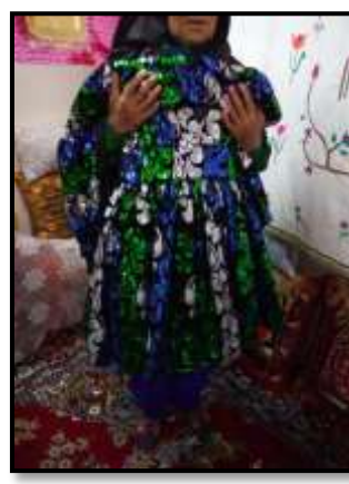
۸- پاجین مجلسی از جنس مخمل دارای ۹- پیراهن سبزرنگ دختران روستا تزیینات فراوان