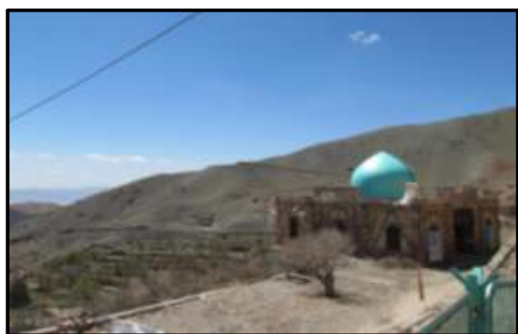
۷- بنای جدید امام زاده بر فراز روستا

در طول تاریخ بنای امام زاده، بارها بازسازی شده و توسعه‌ی آن به همت اهالی تاکنون ادامه دارد. (تصاویر ۶، ۷، ۸)