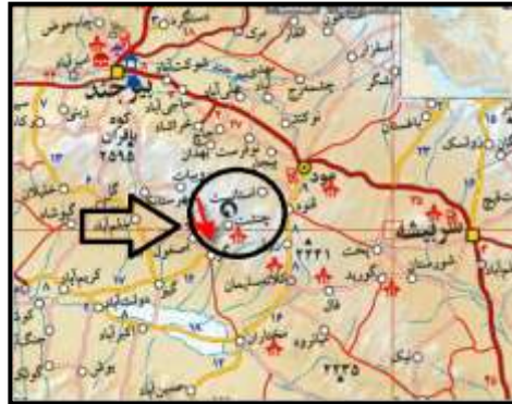
۱ - نقشه راه و فاصله از بیرجند