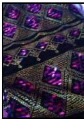
۱۰- پارچه‌هایی با نقوش هندسی از جنس مخمل برای تهیه پیراهن و شلوار- (منبع: نگارنده)