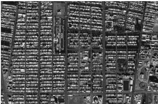
بیرجند - دیاگرام منظم - عدم استفاده از میدان و فلکه

به دلیل اینکه تحلیل فضایی جرم در شهرها به شناسایی الگوهای رفتار مجرمانه، کشف کانون‌های جرم خیز و در نهایت به تغییر این شرایط و خلق فضاهای مقاوم در برابر جرم و رفع نابهنجاری‌های شهری کمک میکند. از این رو بررسی‌های مکانی از اهمیت بسزایی در مطالعه جرم برخوردار بوده و ضرورت بررسی موضوع را دوچندان می نماید. محیط کالبدی می‌تواند به وسیله از بین بردن مکان‌های اختفا و یا راه‌های مناسب فرار، مانع از ارتکاب جرم و رفتار مجرمانه شود. و همچنین میتواند رفتار