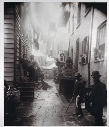
Bandit's Roost (۱۸۸۸) by Jacob Riis تصویری از یکی از جرم خیزترین خیابان های نیویورک