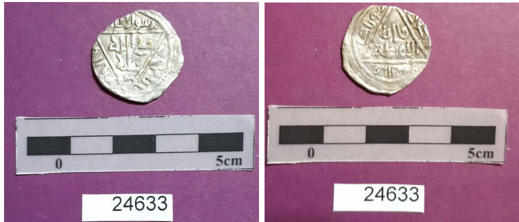
تصویر 4. سکه اوگتای قآن. روی سکه: قآن العادل داخل یک کادر مثلث رو به بالا، پشت سکه: علی ولی الله داخل مثلث رو به پایین و رسول الله در حاشیه. موزه باستان شناسی رشت