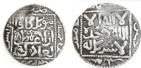
تصویر 10. نمونه‌هایی از تمغاهای حک شده روی سکه‌ها