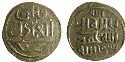
تصویر 5. سکه اوگتای قآن. روی سکه: شعار شیعی لاله الا الله محمد رسول الله، پشت سکه: قآن العادل دارای تصویر کمان؛ موزه ملک