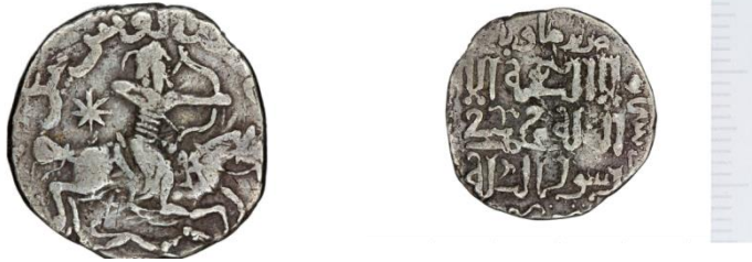
تصویر 7: سکه نقره توراکینا خاتون (مادر گیوگ خان) مغولان، روی سکه سوارکار با تیر و کمان در حال شکار، پشت سکه شعارشعی لا اله الا الله محمدرسول الله، موزه ملک

شعار توحیدی أَشْهَدُ أَنْ لَا إِلَهَ إِلَّا اللَّهُ به معنای گواهی می‌دهم، خدایی جز الله نیست و أَشْهَدُ أَنْ مُحَمَّدًا رَسُوْلُ اللَّهِ به معنای گواهی می‌دهم، همانا محمد پیامبر خداست، بر روی سکه هامشاهده می‌گردد. با گفتن این دو جمله می‌توان مسلمان گردیده شرطی که آگاهانه و نه از سر اجبار این عبارات را بگوید بنابراین این دو جمله علاوه بر ارزش اعتقادی دارای ارزش حقوقی است. البته این عبارات تنها زمانی ارزش معنوی دارد، که فرد معنی و استدلال آنها را بداند و برای قربت به خدا مسلمان شود. با توجه به عدم پذیرش دین اسلام از سوی خان‌های بزرگ مغول و عدم اعتقاد قلبی آن‌ها به دین اسلام، ضرب شهادتین بر روی سکه‌های خان‌های بزرگ مغول تامل برانگیز است. بر روی بیشتر سکه‌های توراکینا خاتون، نقش سوارکار در حال شکار مشاهده می‌گردد. با توجه به تعداد بسیار زیاد سکه‌های ضرب شده توراکینا خاتون با تصویر سوارکار زن بر روی اسب در حال شکار، می‌تواند نمایش خصیصه‌های جنگجویی و قدرت نمایی خاتون مغول در برابر رقبای مرد و نشان دهنده اهمیت جایگاه زن در جامعه مغول می‌باشد.