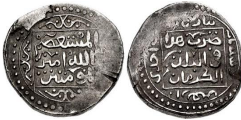
تصویر 6: سکه ۱۰ دیناری توراکینا خاتون، روی سکه مستعصم بالله امیرالمومنین، پشت سکه ضرب هذا فی البلده الکرمان ۶۴۱ هـ ق، مجموعه دارشخصی