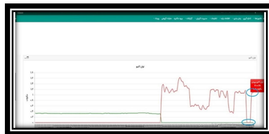
شکل (۲): رویت پذیری قطع و وصل شدن بار فیدر در سامانه مدام