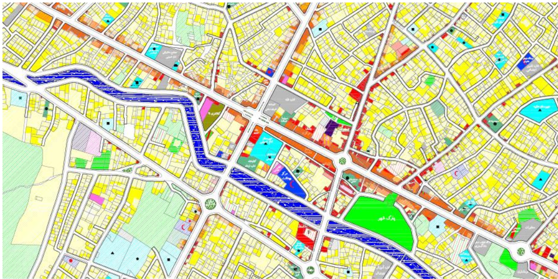
تصویر ۱: نقشه موقعیت شهرستان الیگودرز و محدوده مورد مطالعه

اطلاعات جمع آوری شده در نرم افزار SPSS وارد و در نتیجه به صورت جدول و نمودار ارائه شدند. در این پژوهش از روش آلفای کرونباخ جهت پایایی استفاده شد.